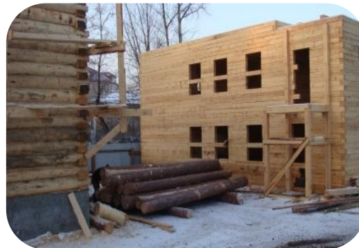
Объект в процессе реставрации