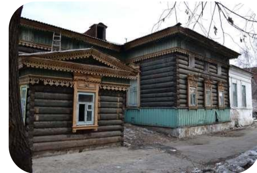
Объект до начала реставрации