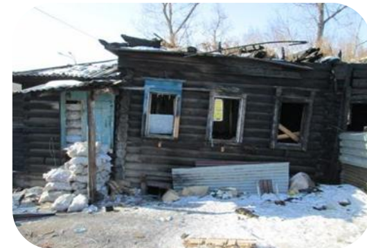
Объект до начала реставрации