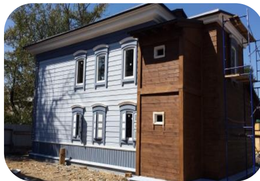
Объект в процессе реставрации