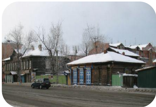
Объект до начала реставрации