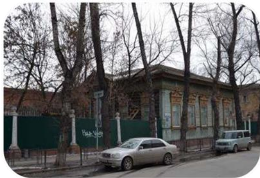
Объект до начала реставрации