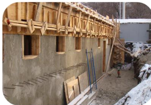
Объект в процессе реставрации