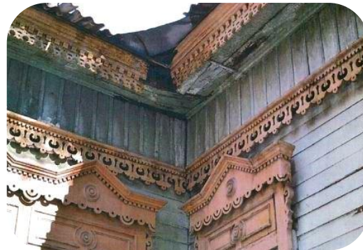
Элементы охраны на фасаде