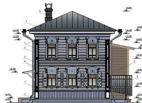
Эскизный проект ул. Байкальская, 25