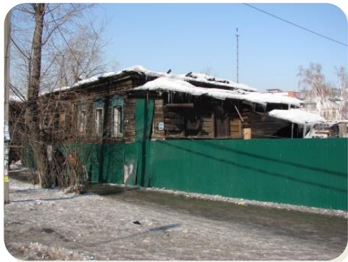
Объект до начала реставрации