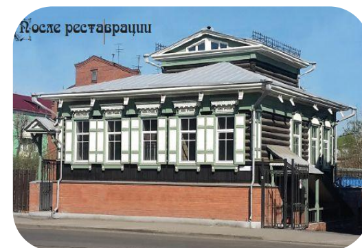
Объект после реставрации