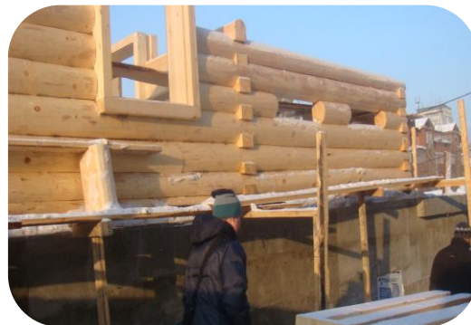
Объект в процессе реставрации