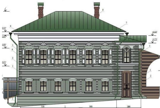
Эскизный проект ул. Байкальская, 27