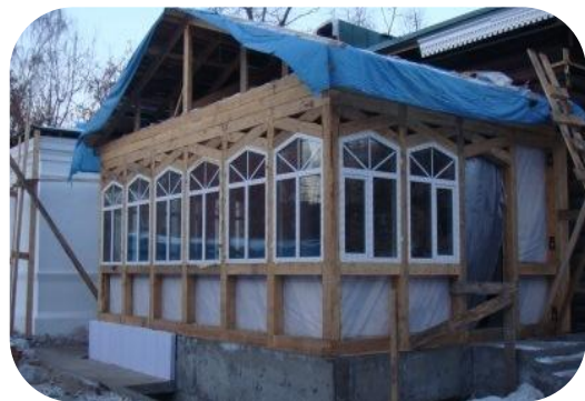
Объект в процессе реставрации